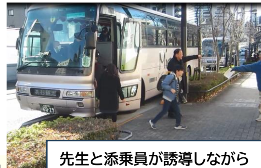
先生と添乗員が誘導しながら 児童が降車する様子