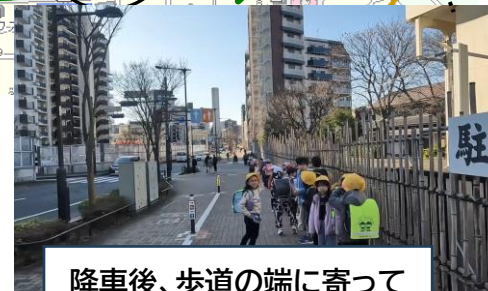
降車後、歩道の端に寄って 通学する様子