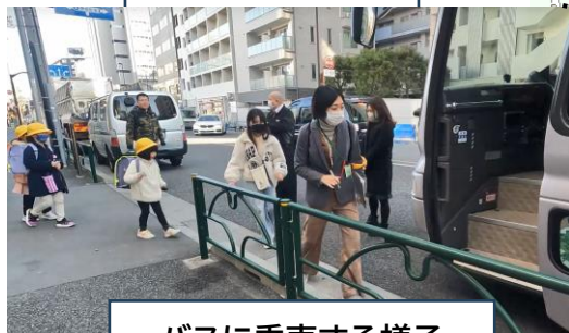
バスに乗車する様子