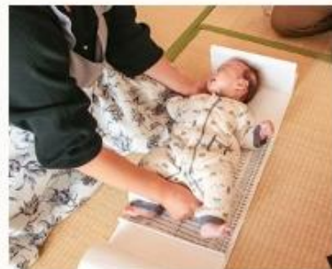
▲身体測定の様子。体のことで気になることも相談できます

助産師による母乳・育児相談や、授乳・沐浴指導などを受けられます。お子さんの身体測定を行い、発育が順調かの確認もできます。