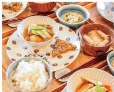
▲こだわりの食材たっぷりの「しらさぎランチ」(しらさぎふれあい助産院)

助産師がお子さんをお世話している間、お母さんはゆっくり過ごせます。食事やマッサージがある施設も(別料金の場合あり)。