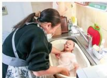
▲自宅にあるものを使って、一から丁寧に説明します

アウトリーチでは、自宅に助産師が訪問するので、家族と一緒に沐浴指導を受けることができます。自宅での過ごし方などを相談するのもおすすめです。