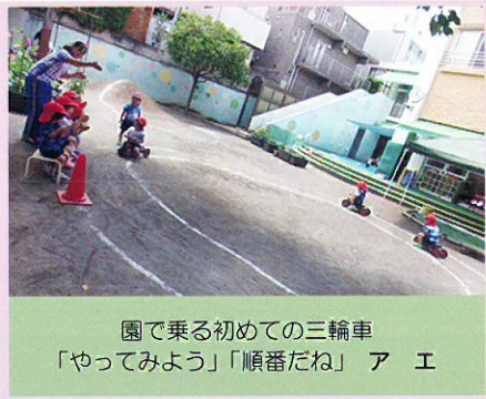
園で乗る初めての三輪車 「やってみよう」「順番だね」 ア エ