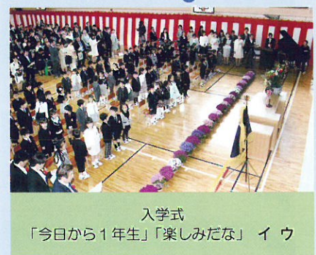
入学式 「今日から1年生」「楽しみだな」 イ ウ