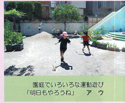
園庭でいろいろな運動遊び 「明日もやろうね」 ア ウ