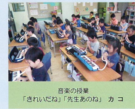
音楽の授業 「きれいだね」「先生あのね」 カ コ