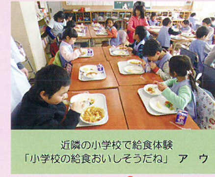
近隣の小学校で給食体験 「小学校の給食おいしそうだね」 ア ウ