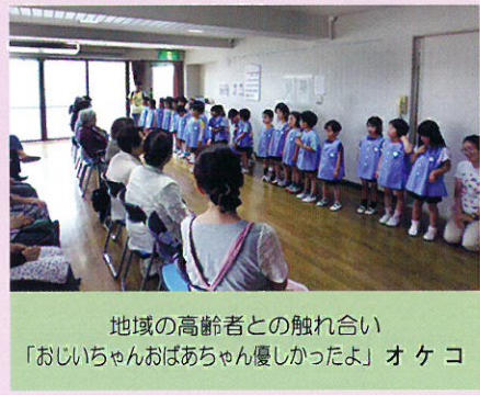
地域の高齢者との触れ合い 「おじいちゃんおばあちゃん楽しかったよ」 オ ケ コ