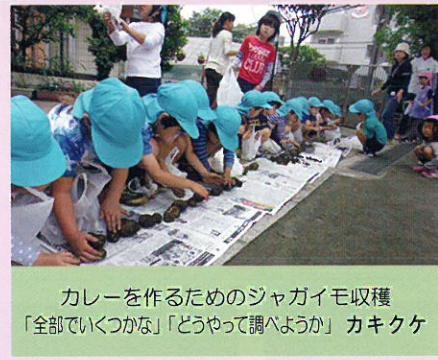
カレーを作るためのジャガイモ収穫 「全部でいくつかな」「どうやって調べようか」 カキクケ