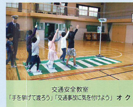
交通安全教室 「手を挙げて渡ろう」「交通事故に気を付けよう」 オ ク