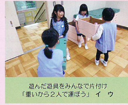
遊んだ遊具をみんなで片付け 「重いから2人で運ぼう」 イ ウ