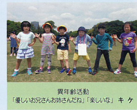
異年齢活動 「優しいお兄さんお姉さんだね」「楽しいな」 キ ケ