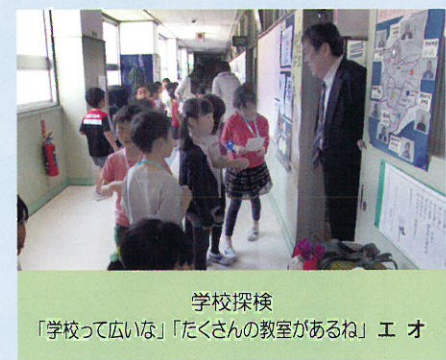
学校探検 「学校って広いな」「たくさん先生の教室があるね」 エ オ