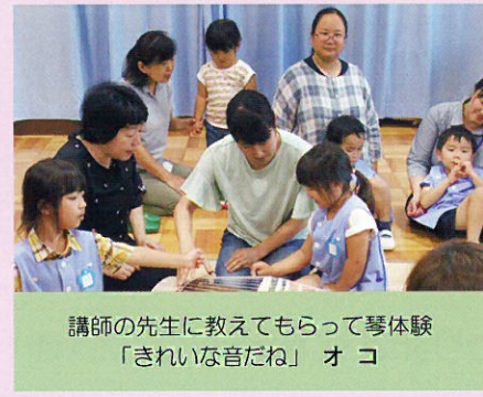
講師の先生に教えてもらって琴体験 「きれいな音だね」 オ コ

幼児期の終わりまでに育てほしい姿（10の姿） ア 健康な心と体 イ 自立心 ウ 協同性 エ 道徳性・規範意識の芽生え オ 社会生活との関わり カ 思考力の芽生え キ 自然との関わり・生命尊重 ク 数量や図形、標識や文字などへの関心・感覚 ケ 言葉による伝え合い コ 豊かな感性と表現