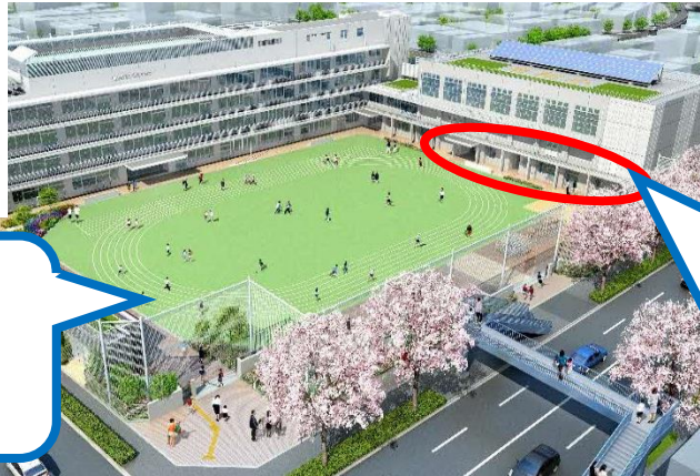
キッズ・プラザ令和