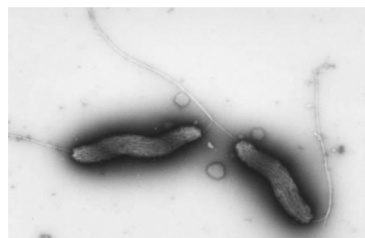
カンピロバクターの電子顕微鏡写真