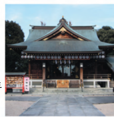
【御朱印受付時間】 9時～17時

沼袋1-31-4 (関東バス：新井小学校) ☎ 03-3386-5566 八岐大蛇(やまたのおろち)を退治した須佐之男命(すさのおのみこと)が祀られている神社。旧野方村の総鎮守。由緒は南北朝時代、正平元年(1346)まで遡ると言われている。境内にはご神木の「三本願い松」や、三回撫でると安産に御利益があるとされる、子どもを抱いてあやしている「子育て狛犬」などがある。