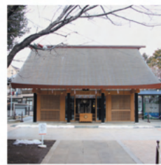
【御朱印受付時間】 9時～17時

新井4-14-3 (関東バス：北野神社) ☎ 03-3388-0135 文武両道の神とされる菅原道真公、食物を司る保食神(うけもちのかみ)が祀られている神社。旧新井村の鎮守であり、「新井」の地名の由来となった井戸が境内に。また、菅原道真公のおつかいとされる牛の像、「撫で牛」も安置されており、撫でると病気平癒や、学業など諸願成就に御利益があるとされている。