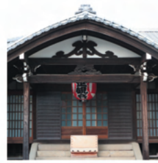
【御朱印受付時間】 10時～16時

上高田1-27-3 (関東バス：白桜小学校入口) ☎ 03-3361-2345 臨済宗妙心寺派の寺院。門前にさるの石像がある、通称"さる寺"。由来は、神楽坂に当寺があった頃、渡し船に乗ろうとしていた和尚を小さるが引き留めたと、目の前で船が沈み、小さるのおかげで難を逃れたことから。山の手三十三観音霊場第二番札所、東京三十三観音霊場第十九番札所。