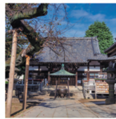
【御朱印受付時間】 9時～17時

新井5-3-5 (関東バス：新井薬師梅照院前) ☎ 03-3386-1355 永禄年間(16世紀中頃)、光明が差し現れた御本尊は、国内でも稀な二仏一体のご尊像(薬師如来・如意輪観音)。江戸時代、徳川秀忠公の娘和子の方(東福門院)の不治の眼病が祈願により快癒したことから、治眼薬師と言われる。多くの子どもたちを救った歴史もあり、子育て薬師としても親しまれ、良縁成就を授かる。