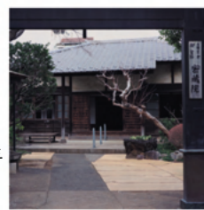
【御朱印受付時間】 9時～16時30分

沼袋2-33-4 (関東バス：江古田二丁目) ☎ 03-3386-0190 戦国時代後期、北條氏の持仏を本尊とし、小田原城内に創建されたのが起源。真言宗御室派の寺院。慶長16年(1611)に江戸失の倉、正保元年(1644)に浅草寺町に移転。大正・昭和期には関東大震災・戦災で二度焼失した。その後、昭和25年(1950)に現在地に本堂が再建された。御府内第四十一番札所。