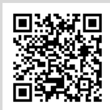
▲キッチンカー出店申込フォーム