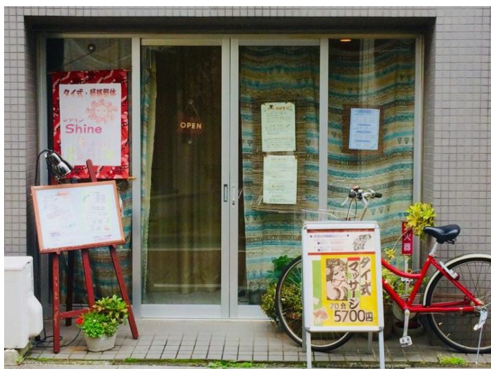
緑あふれる入り口が目印！「OPEN」のサインがあります

住宅街の歩きやすい道路をまっすぐ進むと、上高田本通りにかわいい店構えを発見！読みやすいメニュー表と、赤い自転車は遠くからでもすぐ分かります。