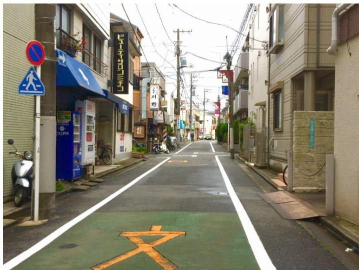
西武新宿線「新井薬師前駅」南口から徒歩4～5分

住宅街の歩きやすい道路をまっすぐ進むと、上高田本通りにかわいい店構えを発見！読みやすいメニュー表と、赤い自転車は遠くからでもすぐ分かります。