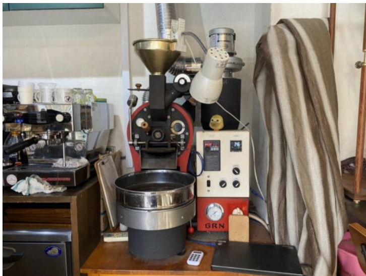
店内の自家焙煎機

絶妙な加減で焙煎することで、産地それぞれの豆の個性を引き出しながら、非常にクリアで甘みのある口当たりになります。そんな自慢のコーヒー豆のお買い求めはもちろん、抽出されたコーヒーを店内でもテイクアウトでもいただくことができます。