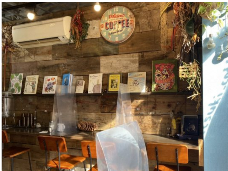
ニュージーランドの森の中をイメージした店内