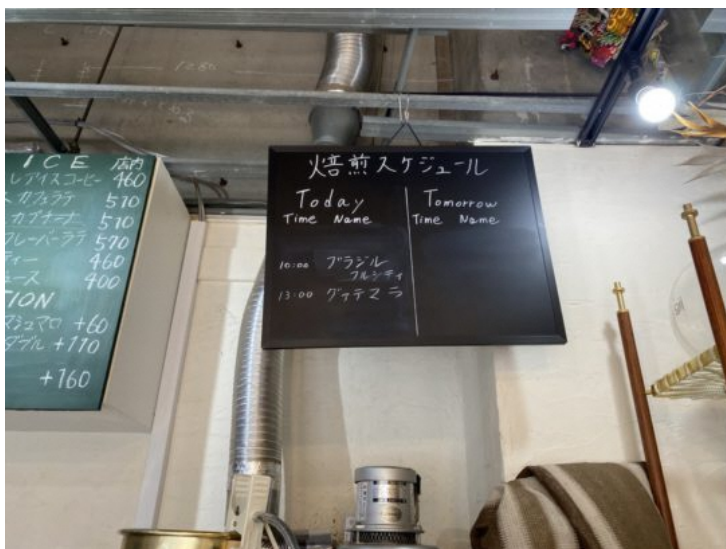
その日の焙煎スケジュールは店内に掲示されています

絶妙な加減で焙煎することで、産地それぞれの豆の個性を引き出しながら、非常にクリアで甘みのある口当たりになります。そんな自慢のコーヒー豆のお買い求めはもちろん、抽出されたコーヒーを店内でもテイクアウトでもいただくことができます。