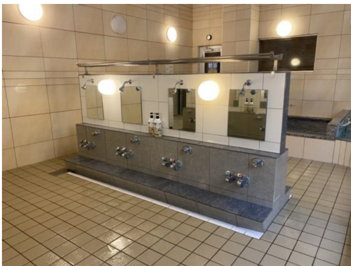
立ちシャワーは人気のRefa FINE BUBBLESとミラブルを導入

個性豊かな浴槽とサウナが楽しめる、魅力たっぷりの「アクア東中野」。 ぜひ1度訪れてみてはいかがでしょうか？