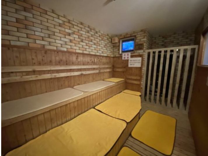
女湯のコンフォートサウナ

住宅地の一角にあるアクア東中野。以前は近隣のお客様がほとんどでしたが、近年のサウナブームの影響もあって、中野区外からの若いお客様が急増しているそうです。