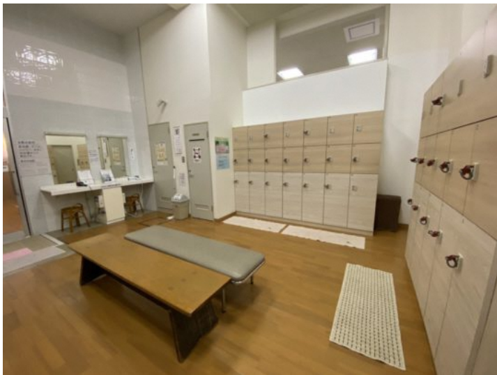
綺麗な脱衣所では最新ドライヤーを完備