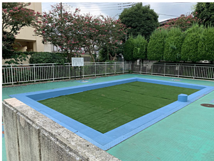
丸山公園 じゃぶじゃぶ池（夏季のみ）