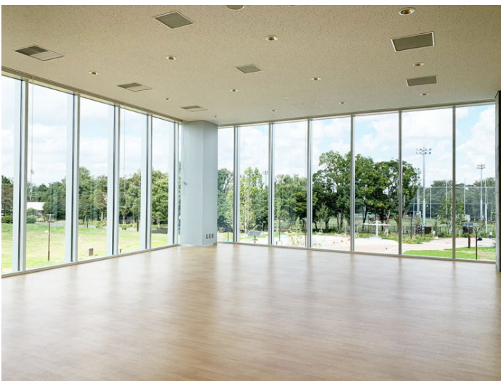
開放感のある多目的室

「キリンレモンスポーツセンターは非常に充実した設備と広さを持つ建物なので、区内でもとても目立つ存在であると認識しています。それだけに周りの皆さんも納得してくれる様な運営をしていきたいと思っています。中野区も様々なイベントが多いですが、我々としてはまだ具体的なプランは思いついてはいないものの、地元警察や消防署と連動したイベントをもっと積極的に行えたら、と考えています。他にも、平和の森公園の中にあるといったロケーションを活用したイベントもやりたいですね。この施設は2Fの多目的室をはじめとして、室内からの景色が素晴らしいというアピールポイントがあります。その開放感を利用して、室内に居ながらの“青空ヨガ”なんかもおもしろいのではないのでしょうか。」