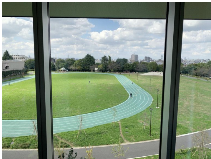
館内からは平和の森公園が一望できる

「あと、まだどうなるかはわかりませんが、今年はオリンピックに関わる年でもあります。キリンレモンスポーツセンターは、オリンピック公式の卓球練習会場として認定されています（※開催中は施設名称は「中野総合体育館」で運営）。もともと卓球に関しては、毎月一回大会が行われている等、中野区民の関心は高めですが、オリンピックを機に卓球をはじめとするスポーツへの関心もますます高まるのではないのでしょうか。そんな時に、その興味・関心をより強く持ってもらえるような環境やイベントをご用意できるように、今後も取り組んでいきたいと思っています」