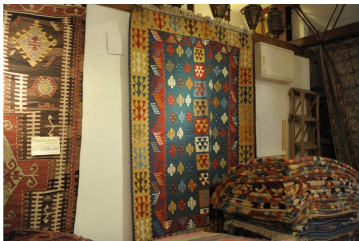
新品のキリム (20万円/税込)

キリムには新品だけでなく、遊牧民が実際に使用していた「オールドキリム」や100年以上前の「アンティークキリム」など、飾って楽しんだりする世界的に貴重なコレクション品となっているものもあります。