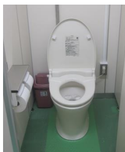
【洋式になったトイレ】

来年度の夏休みにも追加の改修工事を行い、平成 32 年 4 月の統合に向けた校舎の準備を進めます。