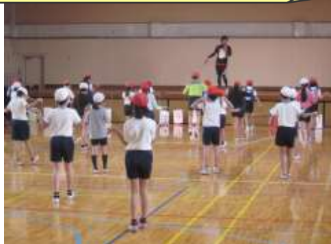
みんな一緒に仲良くなわとび

統合対象校では、統合後の学校運営を円滑に行うために交流事業を実施しています。2月12日に中野神明小・多田小・新山小の4年生が参加した「なわとび教室」が行われました。