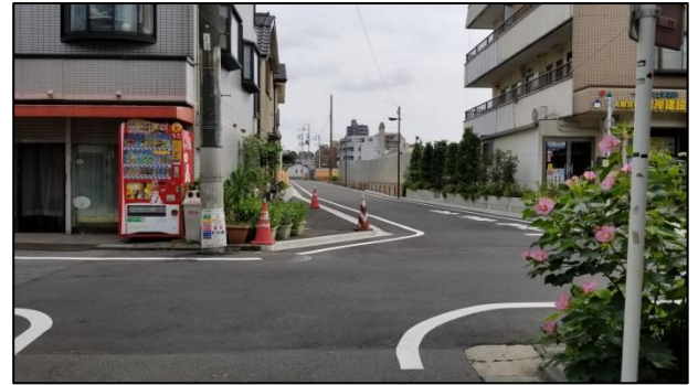
■ 避難道路整備（整備後）