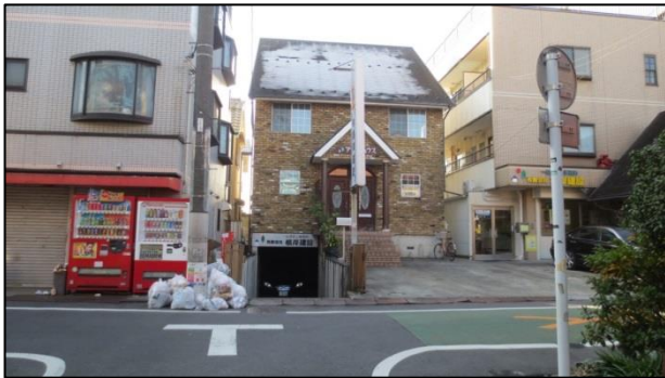
■ 避難道路整備（整備前）