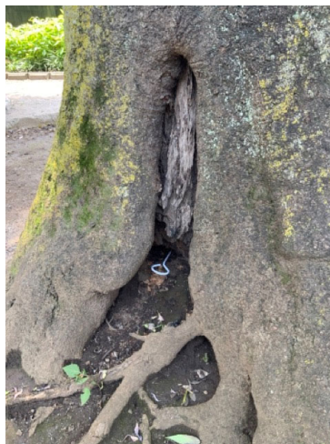
②根元から幹にかけての開口空洞