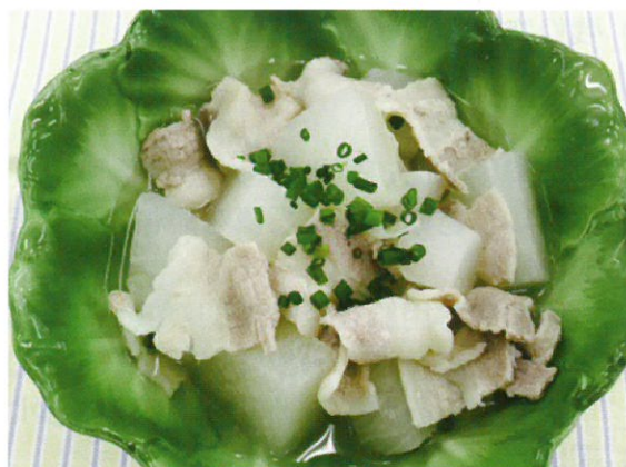
※写真：中野区と新渡戸文化短期大学が連携して作成した『あまりにも美味しいあまりものレシピ』より