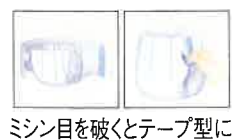
ミシン目を破くとテープ型に