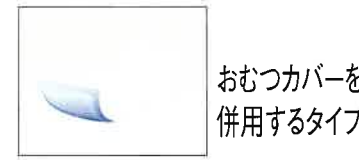
おむつカバーを併用するタイプ