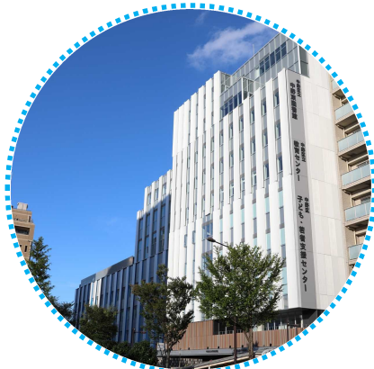
中野区子ども・若者支援センター (みらいステップなかの)