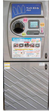
▲ペットボトル自動回収機

☆設置場所やポイント利用などについて詳しくは、区HPをご覧ください。資源回収推進係へ問い合わせを