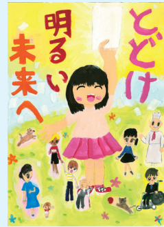
▲昨年度、文部科学大臣・総務大臣賞を受賞した小学生の作品

申込み 学校へ直接提出するか、作品裏面の右下に学校名、学年、氏名とふりがなを記入して9月9日までに直接、区選挙管理委員会へ ☆詳しくは、区HPを確認を