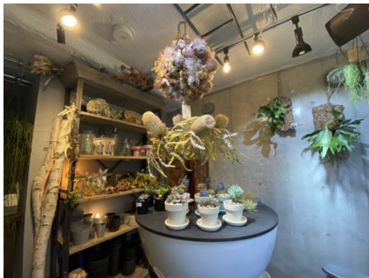
店内奥のギャラリースペース

フラワーショップとカフェが融合した「F.F.O FLOWERS AND COFFEE」ですが、実は店内奥にギャラリースペースもあります。アクセサリやイラストなどの展示会を不定期に開催。昨年の11月には店内に高座を作り、落語会を開催したそうです。