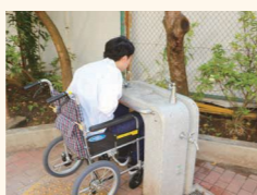
◀ 車いすでも利用しやすいユニバーサルデザインに基づいた水飲み場