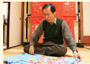
なかの発! → 中野で活躍する文化人を幅広く紹介します

言葉は明快だ。弟子を置く予定はないが、2年ほど前から、友禅を勉強したい一心で来日した韓国女性に技を教えている。何年もかけて日本語を習得し、日本の服飾系の短期大学で学んだ上で、教えを請いに来た彼女とは、今では家族ぐるみの付き合い。日本の伝統工芸は、世界へと広がっている。