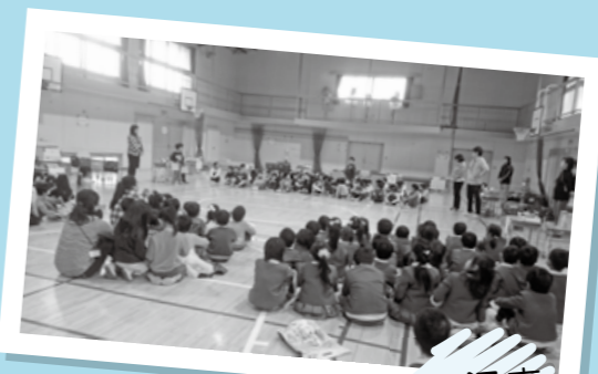
交流スナップ① 江古田小学校 「また行きたいな」 ▲「おもちゃランド」を近隣の金の峯幼稚園、徳田保育園、なかよしの森保育園の園児が訪問。1年生手作りのポウリングのゲームなどで歓迎を受け、緊張しながらも楽しく交流しました