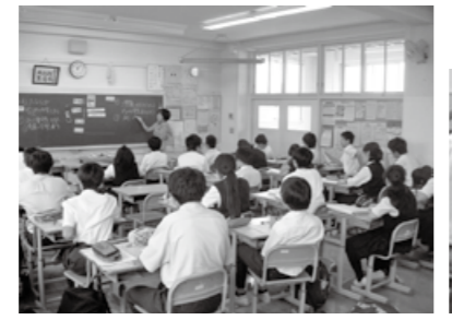
▲理科マイスターによる授業(緑野中学校)

区は、「教育マイスター」の認定制度を継続して実施しています。認定の対象は、区立の幼稚園、小・中学校の園長・校長から推薦され、1年間の研修を受講した教員。認定後は、学級経営、教科指導、教材作りなどの優れた専門性を生かし、若手教員の研修会、また各学校での研究会・研修会の講師等として、指導的な役割を担います。今年度は、新たに3人を認定し、区内の各校で活躍しています。