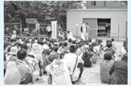
▲保護者や地域のみなさんを行う避難訓練も(鷺宮小学校で)

区立小・中学校では、第2土曜日の午前中に「学校公開」を開催しています(4月、8月、10月、来年3月を除く)。通常の授業の他、専門性の高い各種の教室(交通安全、情報モラル、薬物乱用防止、スポーツなど)、普段の取り組みを更に進めた講座や発表(音読発表会など)、地域とも関わりの深い活動(地域清掃、避難訓練など)、各種の催し(子ども祭り、国際交流、講演会、学校説明会など)等、各校の特色ある内容をご覧ください。ぜひ、お近くの学校へお越しください。☆当日直接会場へ。どなたでもご覧になれます。各校の学校公開や行事の開催日程などは、区HPで確認を