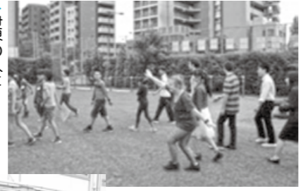
世界のひとなかよくしよう (塔山小学校)