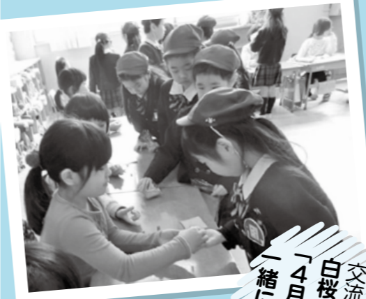
交流スナップ② 白桜小学校 「一緒に学びたいな」 ▲1年生の生活科の秋の自然学習で、木の実や落ち葉の「おもちゃやさん」にひがしなかの幼稚園の園児を招待。また、6年生の幼稚園での職場体験では職業への思いなどを考える契機に