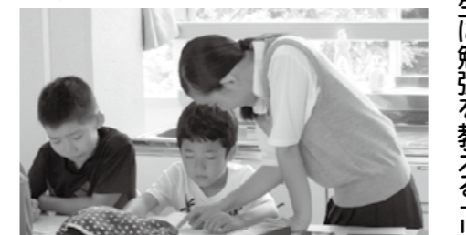
▲夏季リトルティーチャー 北中野中学校・武蔵台小学校

また、中学生が小学生に勉強を教える「リトルティーチャー」運動会でのボランティアなど、各中学校区で独自の取り組みも始まりました。オープンキャンパス等の機会に、ぜひ学校の様子をご覧ください。