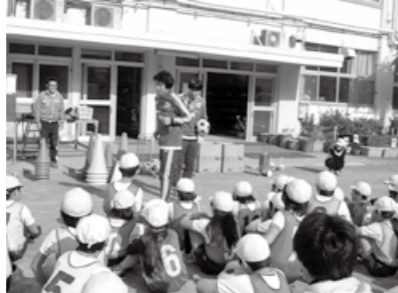
5・6年生 トップアスリートとのスポーツ体験 (塔山小学校)

今年度は、区立の幼稚園、小・中学校の全てが「オリンピック・パラリンピック教育推進校」です。子どもたちの体力向上、ボランティアアミンド醸成、国際感覚育成などのため、アスリート(競技者)を招いてのスポーツ実技指導や外国出身の方々との交流など、各校・園それぞれが工夫して展開します。