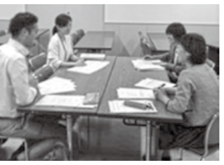
▲教育マイスター開講式で

耳寄り情報③ 区立小・中学校を公開しています 〜子どもたちの学校での様子を見てください〜