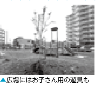
▲広場にはお子さん用の遊具も

公園維持・管理担当/8階 TEL(3228)8849 FAX(3228)5677