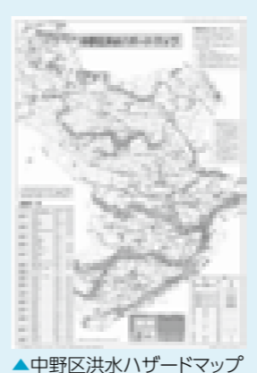
▲中野区洪水ハザードマップ

また、区内の急斜面で崩壊した場合に住宅や公共施設などに被害が生じるおそれがある場所として、急傾斜地崩壊危険箇所が14か所指定されており、中野区地域防災計画別冊資料で確認できます。