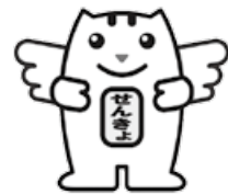
▲明るい選挙 イメージキャラクター 「選挙のめいすいくん」

4月26日、中野区議会議員選挙が行われました。4月27日の開票の結果、下表に太字で書かれた42人の方が中野区議会議員に選ばれました。 なお、今回の区議会議員の立候補者は59人で、投票率は40.44%でした。