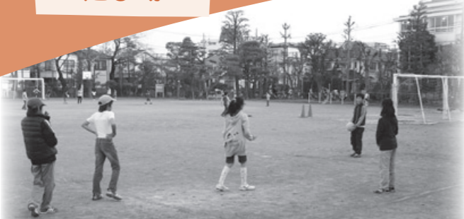
校庭で元気にボール遊び

「キッズ・プラザ」は、小学生が学年を超えてのびのびと交流し、豊かな体験ができるように、小学校の校庭や体育館などを活用した放課後の遊び場です。子どもたちが過ごしやすい空間になるよう教室などを改修し、専用の活動室を設けています。