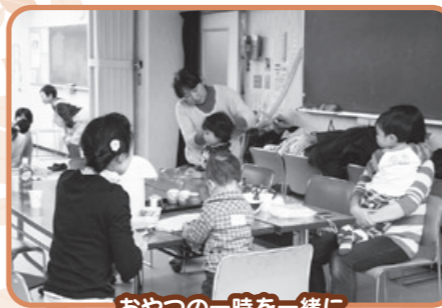
おやつの一時を一緒に

参加したお母さんからは「友達の紹介で参加し始めてまだ2回目ですが、スタッフの方の手際が良く、安心して楽しめました」「二人の子どもがおり、通算で3年程お世話になっています。他のお母さんたちとおしゃべりできたり、自分の食事の間はスタッフの方が子どもを見てくれてたりと、楽しく過ごせて息抜きもできるので、とても感謝しています」といった声が聞かれました。