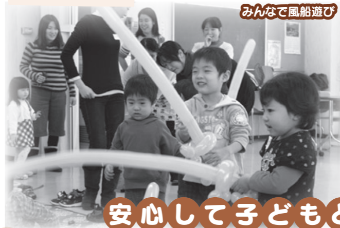
みんなで風船遊び

「まちなかサロン」は、乳幼児親子から高齢者まで、区民のみなさんが気軽に集える「憩いの場」です。おしゃべりをしたり、お茶や食事を楽しんだりして過ごせ、地域の交流の機会となっています。