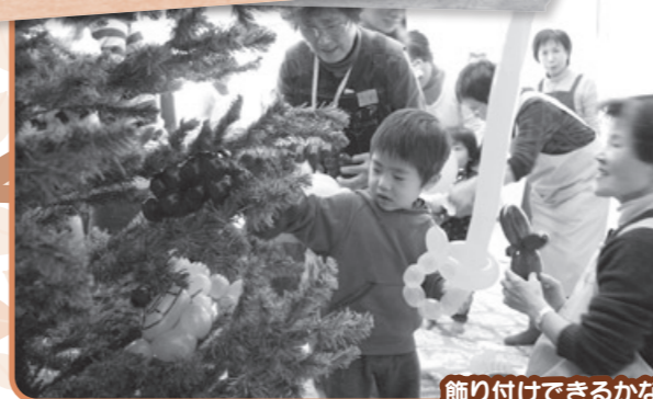
飾り付けできるかな