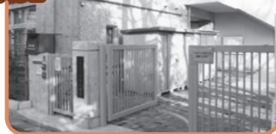
昨年11月に開設した キッズ・プラザ緑野 入り口

キッズ・プラザでは、家庭、地域、学校と連携し、さまざまな事業を実施しています。今回は、地域団体の協力で行われたキッズ・プラザ緑野の催しを紹介します。