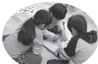
活動室でボードゲーム

現在、区内の7小学校内(塔山・白桜・新山・江古田・桃花・武蔵台・緑野)にあり、今後も順次整備を進めていきます。