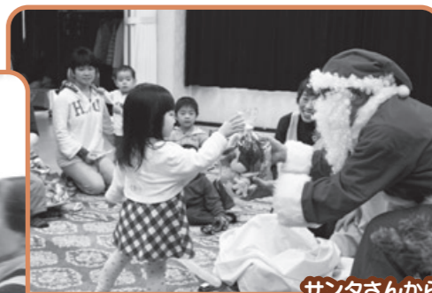
サンタさんからプレゼント

昨年12月の開催日は「クリスマス会」。親子12組が参加し、まずはみんなでクリスマスツリーを飾り付けました。奇麗に出来上がったツリーを見て、子どもたちは大喜び。