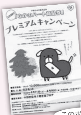
このポスターが目印

4月11日(土)~16日(木) 午前9時~午後4時 ☆先着順で販売。売り切れ次第終了