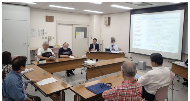
■第7回まちづくり検討会の様子