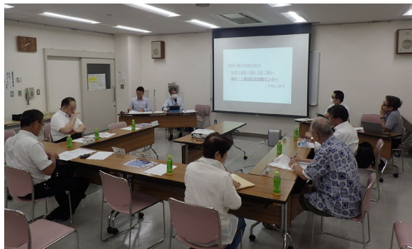
■第8、9回の検討会テーマ