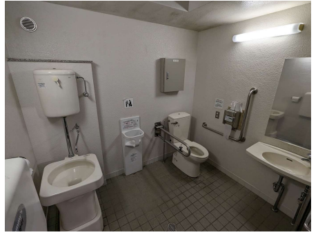
トイレのイメージ写真 ※トイレ中の配置やタイル色彩等が写真とは異なります。