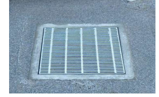
雨水浸透施設のイメージ図

■園路の設置■ 公園入口からトイレまでのバリアフリー導線を確保するため、点状・線状ブロック付の園路を設置いたします。※既存樹木は可能な限り残せるか検討いたします。