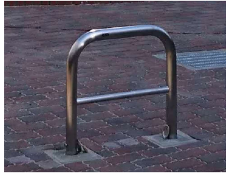
触知案内板・車止めのイメージ写真