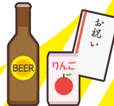
町会の集会や旅行等の 催し物への寄附や 飲食物の差し入れ