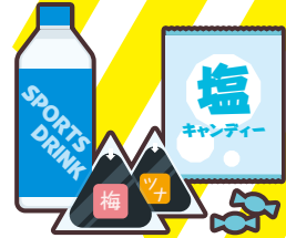
運動会やスポーツ大会への 飲食物の差し入れ