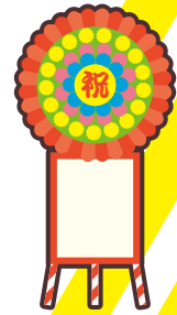
落成式・開店祝いの花輪