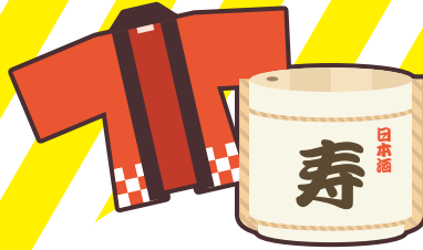
お祭りへの寄附や差し入れ