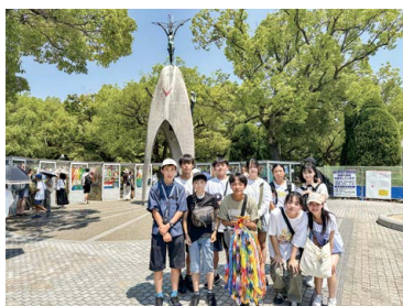
▲平和の旅に参加した中学生

内容 ウクライナ出身のプロチェロ奏者などによるコンサート、ウクライナでの戦争体験インタビュー、令和7年度「平和の旅」報告会 日時 1月25日(日)午後1時～3時40分(午後0時30分開場) 会場 なかのZERO小ホール(中野2-9-7) ☆当日直接会場へ。 先着500人。☎(先着9人)希望の方は、1月5日～14日に電話で、平和・人権・男女共同参画係へ。 手話通訳あり