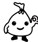
▲中野区ごみ減量 キャラクター 「ごみのん」