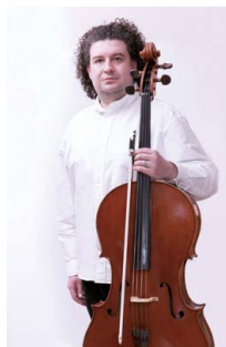
▲プロチェロ奏者 グリブ・トルマチョフ氏