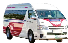
▲この車の愛称とロゴマークを募集します