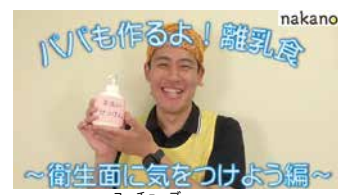
▲区公式YouTubeチャンネルでも、パパ向け離乳食動画を配信中

申込 12月17日～1月14日に電子申請か、電話または直接、中部すこやか福祉センターへ ☆先着8人