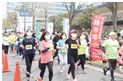
▲会場には露店も並びます