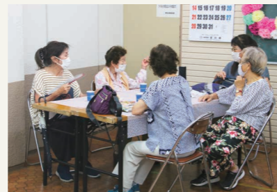
▲オレンジカフェ「おしゃべりカフェ」の様子