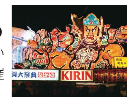
▲模擬店の他、ねぶたの運行なども楽しめます