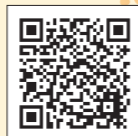
区民活動センター の施設案内

★内容や会場などについて詳しくは、担当の区民活動センターHPまたは広報紙をご覧ください、問い合わせを