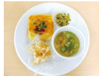
▲薬味やだしのうまみを上手に活用(当日のメニューとは異なります)

会場 南部すこやか福祉センター 申込み 8月6日～9月10日に電子申請か、電話または直接、南部すこやか福祉センターへ。先着30人。