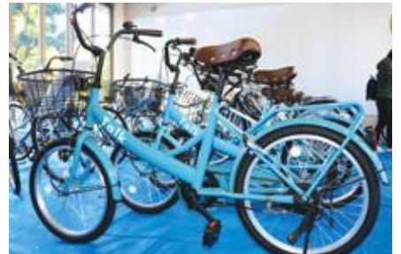
▲9月以降も毎月第3木曜日に実施

☆天候による当日の開催可否、販売日以降の在庫状況については、同センターHPをご覧ください。電話で問い合わせを