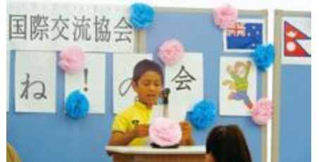
▲子どもたちの学習の成果をご覧ください