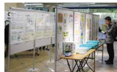
▲来場すると、なかのエコポイント50ポイントをもらえます