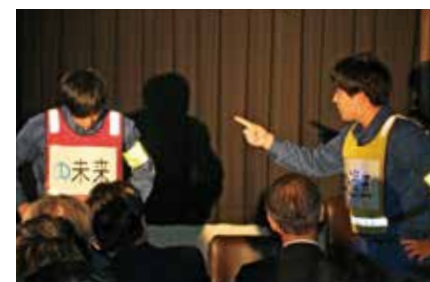
▲演劇を交えた発表をする職場も