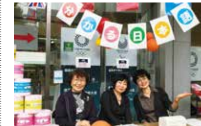
▲お気軽にご参加ください