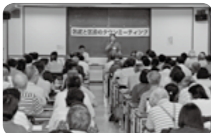
▲7月25日のタウンミーティングでは、209人の参加者がありました

☆当日直接会場へ。一時保育・手話通訳希望の方は、各開催日の7日前までに電話またはファクシミリで、企画担当へ申し込みを