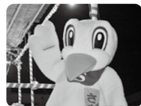
▲鷺宮商明会マスコットキャラクター「さぎプー」も音頭をお披露目