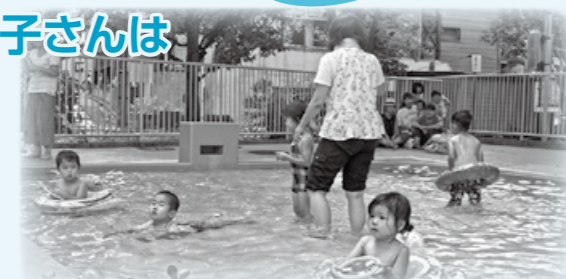
じゃぶじゃぶ池のある公園

実施時間 午前10時～午後4時(正午～午後1時を除く) ☆小学生以上は利用不可。なお、雨天、水温22℃以下、光化学スモッグの発生などで利用休止の場合があります