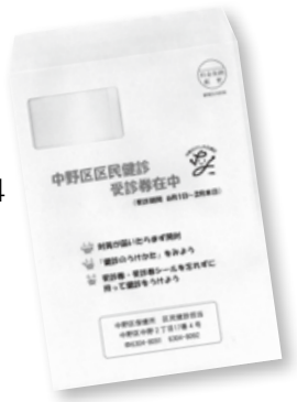
▲実物は茶色の封筒です

全国健康保険協会(協会けんぽ)等が実施する健診については、ご自分の加入先の組合等へ問い合わせを