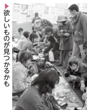
欲しいものが見つかるかも

フリーマーケット リサイクル展示室 松が丘1-6-3 ☎(3228)2411 FAX(3228)5634 会場 リサイクル展示室 開催日時 4月6日・20日、いずれも土曜日、午前10時〜午後1時 ☆出店者の募集は終了 5月の出店者募集 5月4日(土・祝)・18日(土)、午前10時から開催。都内在住・在勤・在学の方が対象。申し込みは、4月1日〜10日に電子申請か、宛先に申込者の住所・氏名を記入した郵便ハガキを持って、直接、リサイクル展示室へ。抽選で各日10人(うち区民優先枠5人) ☆抽選結果は、全応募者にハガキなどで通知