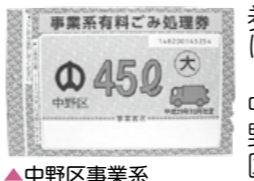
▲中野区事業系有料ごみ処理券

清掃事務所 ☎(3228)5356 FAX(3228)5389 有料ごみ処理券は、中野区のシールの使用を事業系ごみを区のごみ収集に出す場合は「中野区事業系有料ごみ処理券」が、家庭から粗大ごみを出す場合は「中野区有料粗大ごみ処理券」が、それぞれ必要です(いずれもシール状)。他区の有料ごみ処理券は、中野区内では使用できません。