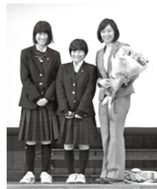
▲日本女子競泳界では初となる、同一大会で三つのメダル獲得を達成した鈴木選手（写真右）

鈴木選手はリオ・オリンピックにも出場しており、現在は、3大会連続の出場となる2020年の東京オリンピックを目指して練習に取り組んでいます。これまでの競泳人生を基にした「思い込んだ時は、これでいくというものがあれば突き進めばいい。挑戦したいことがあれば挑戦しよう」という力強いメッセージは、生徒たちの将来への大きな励みとなったことでしょう。