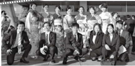
1月14日の成人のつどいには、1,202人の新成人が参加しました