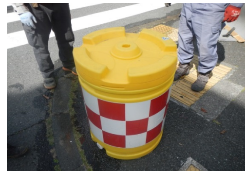
置き型バリケード