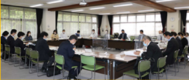
▲懇談会当日の様子

「中野区見守り活動通信」は、区と見守りに関する協定を締結している事業者の皆様の情報共有や連携をさらに進めていくために、年に2回発行しています。