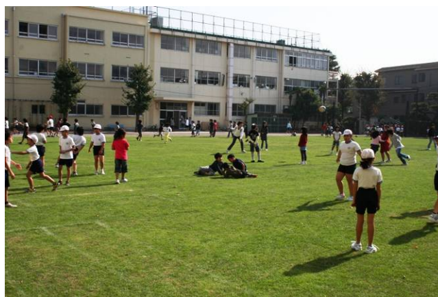
芝生化された小学校校庭