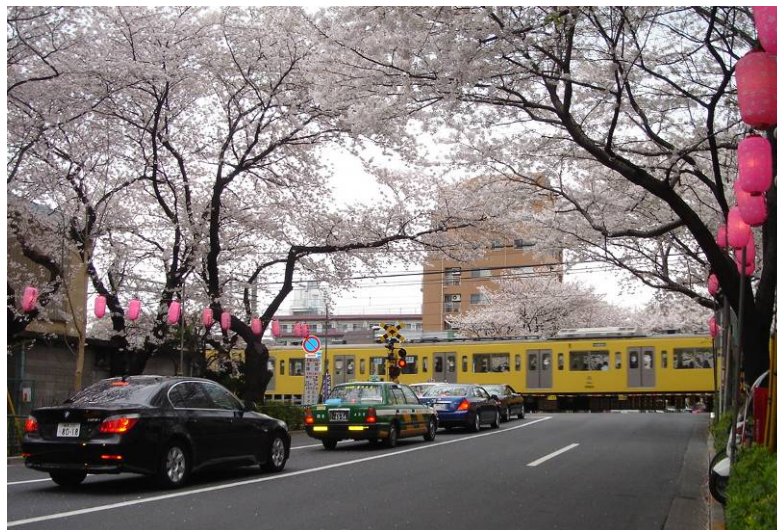
中野通りの桜と西武新宿線

私たちは、一人ひとりが、みずから決定し、行動し、参加して自治を担うことで、心豊かな、いきいきとしたまちをつくります。