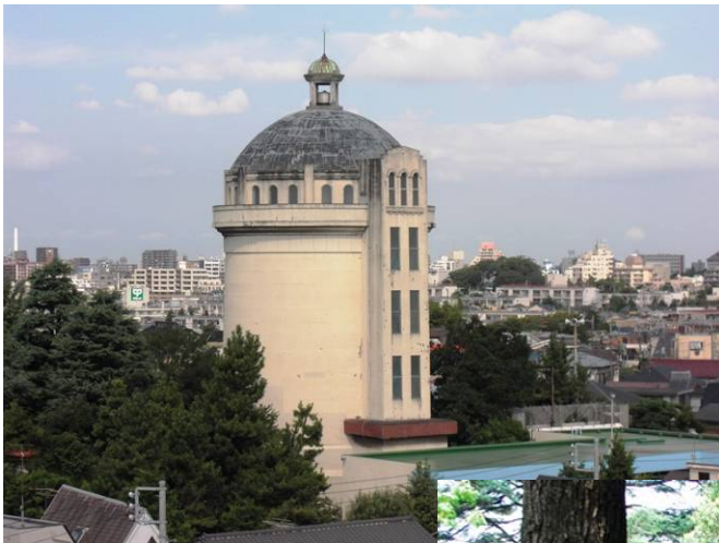
野方配水塔(みずのとう公園内)