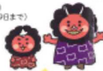
江古田図書館 中野区立図書館 なみちゃん がみちゃん

地下鉄大江戸線新江古田駅より徒歩12分 西武新宿線沼袋駅より徒歩15分 京王バス「丸山車庫」より徒歩2分 関東バス「丸山営業所」より徒歩2分