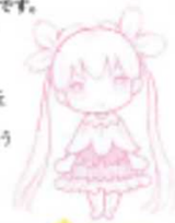
中野区立図書館 中野区立図書館 がみたちちゃん

西武新宿線新井薬師駅より徒歩7分 関東バス、国際興業バス「上高田小学校」バス停より徒歩5分